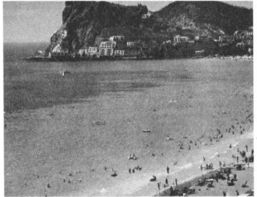
Rhai o ddinasyddion Caerdydd yn poeni ynghylch problemau ariannol y Dinesydd

Dyma fe. Rydych chi wedi clywed am Tenovus. Wel, rhywbeth tebyg yw hwn, ond nid Degohonom mohono. Cymdeithas Un y Cant—dyna'r syniad. Ydy, mae e gennych chi ar unwaith. Pob aelod (trwy wahoddiad yn unig) i gyfrannu 1% o'i gyflog blynyddol, fel rhodd a heb amodau, i gronfa ganolog. Cyn i chi droi'r tudalen, meddyliwch am eiliad—£20 (o leiaf) gan bob teulu Cymraeg yn y ddinas. Mwy gan y rhai sy'n gwneud eu jam gyda'r BBC, HTV, yr Amgueddfa, y Brifysgol, y Colegau Addysg, Cyngor y Celfyddydau y Bwrdd Croeso, y Swyddfa Gymreig, yr Adran Addysg a chorneli bach jamlyd eraill. Tua £30 y teulu ar gyfartaledd, dywedwch. Nawr te, dyma'r cwestiwn. A oes 100 o deuluoedd Cymraeg na fyddant yn dioddef colli rhwng £20 a £40 yr un mewn blwyddyn? Hynny yw, llai na phris bwrdd coffi neu siwt newydd, ynte. Fe gân nhw fynd i Lydaw hefyd, wrth gwrs, a chyfrannu at y Cymrodorion fel o'r blaen, os mynnant hwy. Os oes, dyna £2,000—£4,000 y flwyddyn.