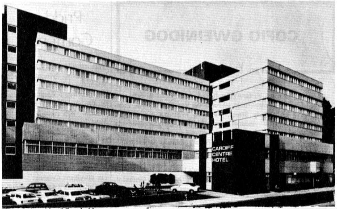
Gwesty diweddaraf Caerdydd yn gweithredu polisi dwyieithog.

Fe gollodd Y Parchedig Raymond Williams ei dad yn ddiweddar. Fe fu farw yn ei gartref yn Llandybie ar ôl salwch hir. Cydymdeimlwn â'r teulu i gyd.