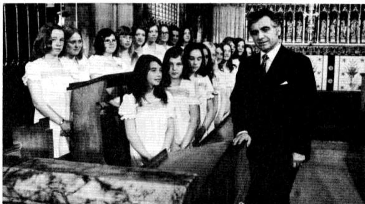
Syr Geraint Evans gyda Chôr Plant Tonyrefail, yn rhaglen HTV. Cymru 'Celebration', a deledir ar ddydd Nadolig.