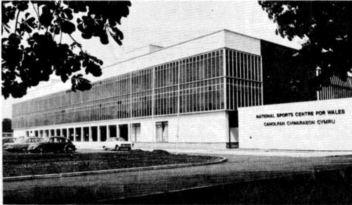
Canolfan Chwaraeon Cymru yng Nghaerdydd.

Beth, meddech chi yw'r ddolen gydiol rhwng y canlynol, Barry John, Jack Petersen, Tony Lewis a Lyn Davies? Wel, yr ateb yn syml yw eu bod i gyd yn gynaelodau neu yn parhau'n aelodau o Gyngor Chwaraeon Cymru a sefydlwyd gan Siarter Brenhinol ychydig dros flwyddyn yn ol. Yr oedd y digwyddiad hwnnw yn bennod bwysig iawn yn hanes chwaraeon yng Nghymru oherwydd gwelwyd sefydlu cyngor annibynnol a chyfrifoldebau arbennig am y tro cyntaf erioed. Cyn symud ymlaen fodd bynnag i siarad am y Cyngor fel y saif heddiw mae'n iawn i dalu teyrnged i'r cyrff ymgynghorol a fu'n gyfrifol am chwaraeon yng Nghymru cyn sefydlu y Cyngor presennol, oherwydd fe sicrhawyd ganddynt seiliau cadarn i adeiladu arnynt.