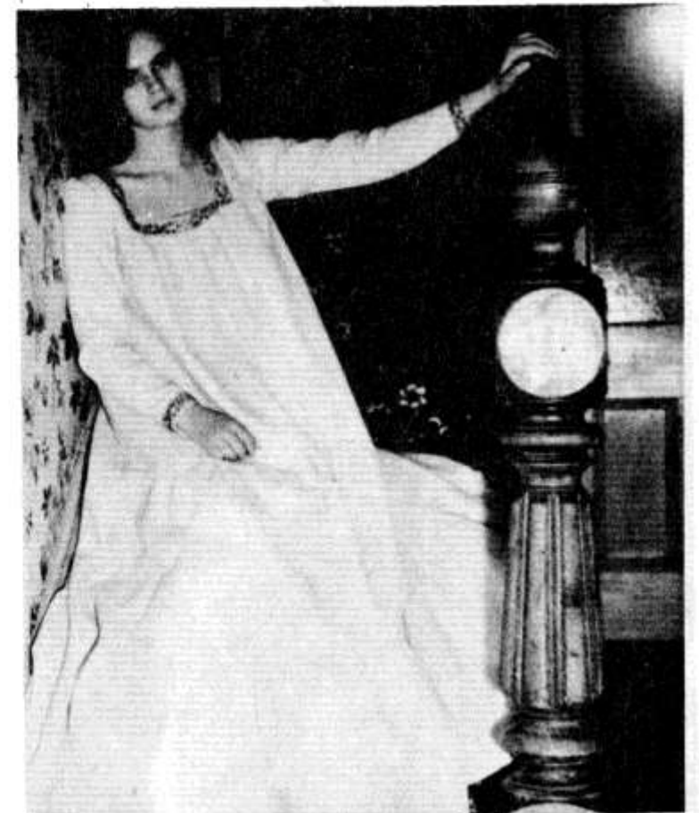
Ffrog laes wlanan - lliw hufen.