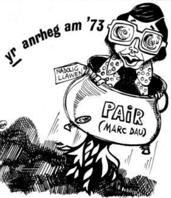
O VAUGHAN I FYNWY

Gallwch archebu eich tocynnau trwy ffonio Caerdydd 591687 neu eu prynu wrth y drws.