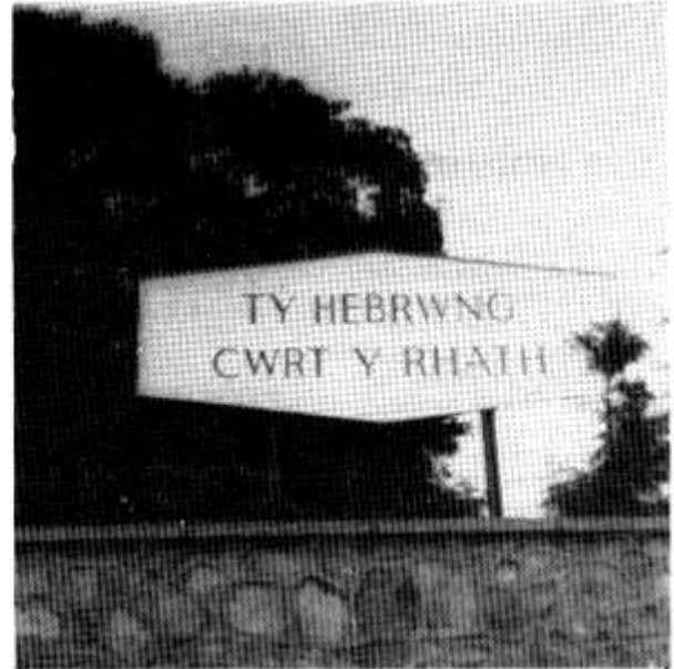
BYWYD I'R IAITH !