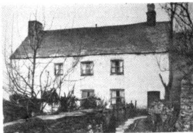
Tynton, Llangeinor, Morgannwg, man geni Richard Price (gweler Rhifyn Mawrth).