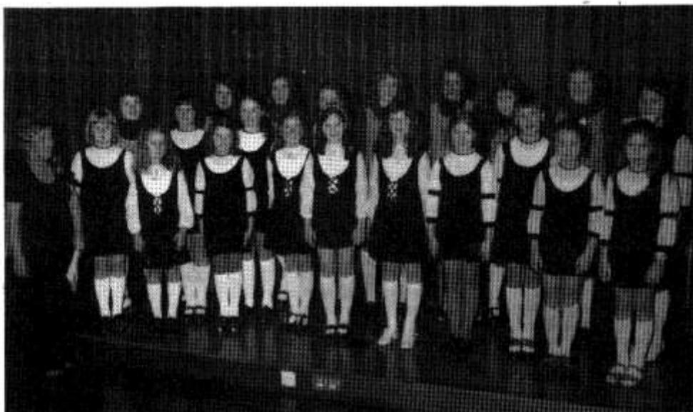
Côr Plant Llanishen