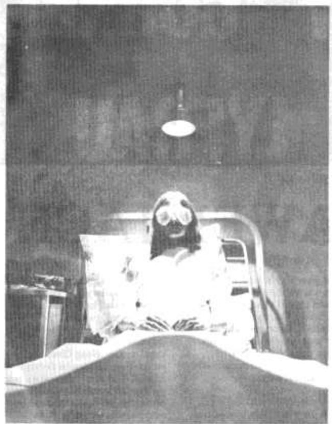
Golygfa o 'Death Kit' a berfformiwyd gan Moving Being.

M.P. Wedi'ch sefydlu does dim dwywaith. Ond fasa chi'n deud fod chi erbyn hyn yn rhan p'r sefydliad.