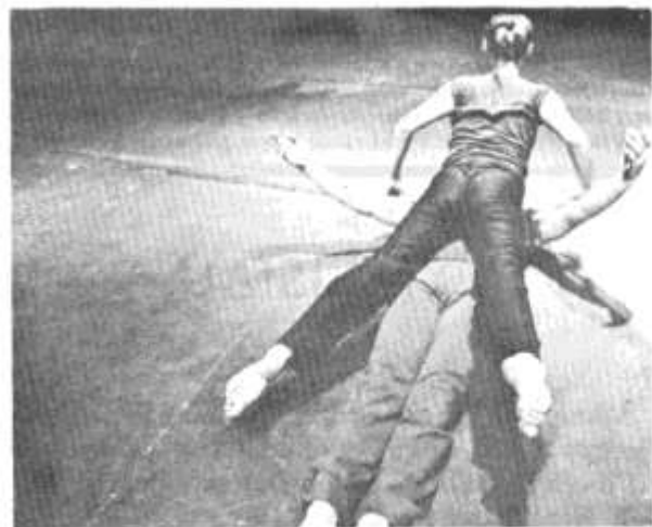
Golygfa o 'Dreamplay' gan Moving Being

B.J. Ma'r rhestr yn ddi-ddiwadd wrth gwrs. 'Da ni'n hynod falch fod 'Moving Being' er enghraiffti wedi gweld i ffor' yn glir i symud o Lunden ddwy flynedd yn ol ag ymgartrefu yma yn 'Chapter' Ma'r grwp dawn, meim a cherddoriaeth yma yn enwog nid yn unig