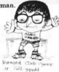
Teyrnged Clwb Cymric i'r Gŵyl Gydd