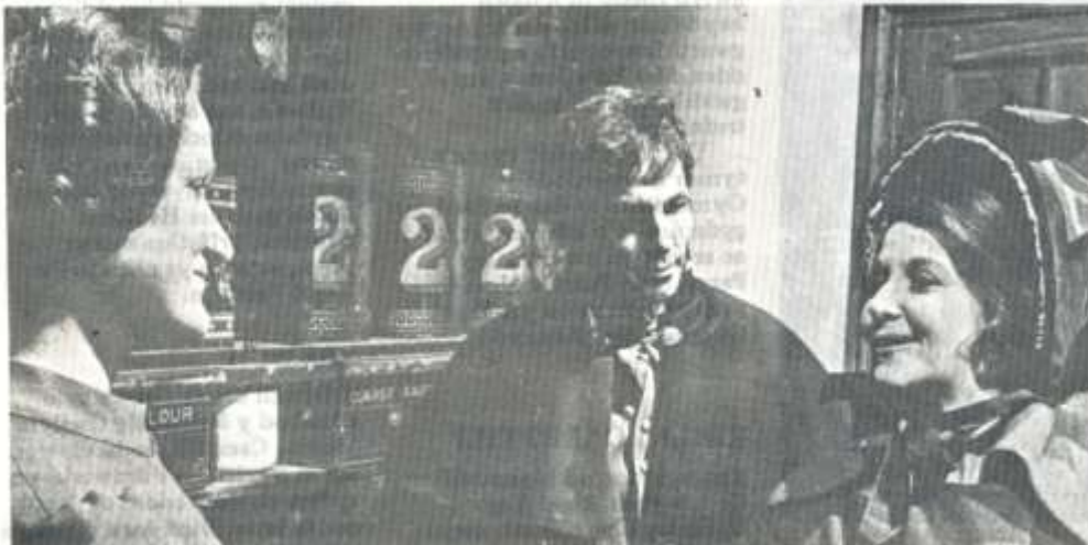
Golygfa o "Merch Gwern Hywel" a deledir yn y Flwyddyn Newydd

GO Wel wrth gwrs mi aethon ni drwy gyfnod o weithio mewn du a gwyn. Mi hoffwn i wneud Brad eto... mewn llaw. Ond yn hytrach nag ail-wneud un o'i ddramau o, dwi'n credu, petawn i'n cael y cyfle, yr hoffwn i neud Blodeuwedd. Mae o'n un o'r petha 'ma sy'n fy meddwl i rownd rîl. Ond na, falla na fedra'i gael yr union gast ydwi i isio... amgylchiada ddim cweit yn iawn... ond mi hoffwn fynd ar ôl Blodeuwedd. Ryw ddydd.