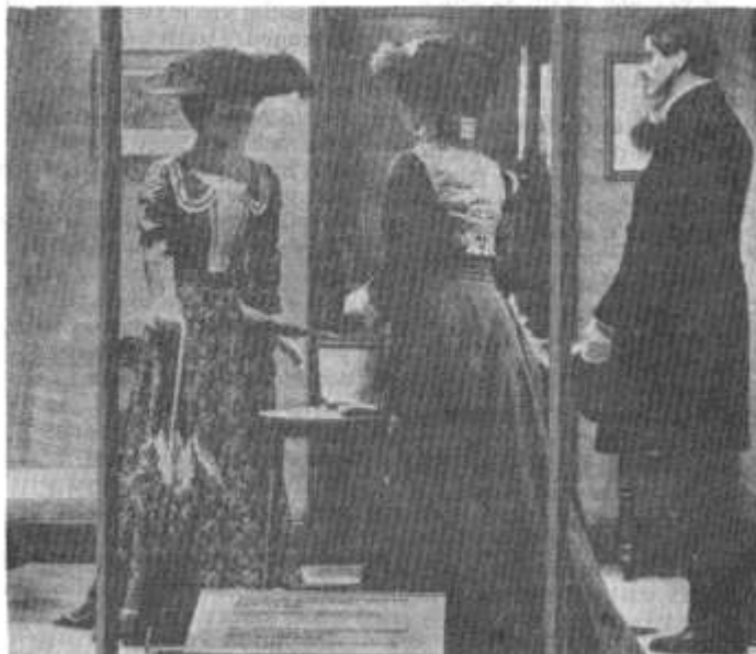
Golygfa o'r Oriol Wisgoedd yn yr Amgueddfa Werin.

Bu ysgrifenyddwyr rhamantus ar ddechrau'r ganrif yn disgrifio wisg y wlad, heb sylweddoli mai wisg tipyn yn hen ffasiwn oedd hi. Cydiwyd yn y syniad a chyhoeddi ei bod yn wisg nodweddiadol o Gymru. Fe'i gwisgwyd gan delynoresau ac aelodau corau ar lwyfan, ac yno y mae heddiw mewn Eisteddfod ac ar ddathliadau Gŵyl Ddewi.