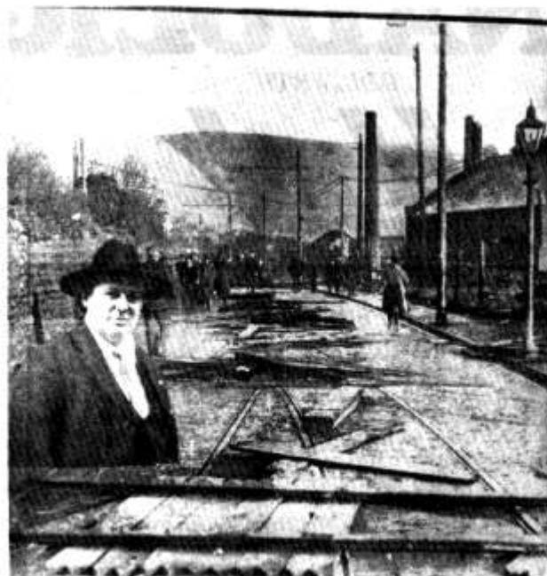
Fotograff a ymddangosodd yn y Daily Sketch, 11 Tachwedd 1910. Rhan o arddangosfa a luniwyd gan Ysgol Ramadeg Tonypany ym 1974 fel rhan o Flwyddyn y Cymoedd, o'r enw Terfysg Tonypany 1910-11. Yn yr Amgueddfa Genedlaethol, Rhagfyr 20-Ionawr 11.