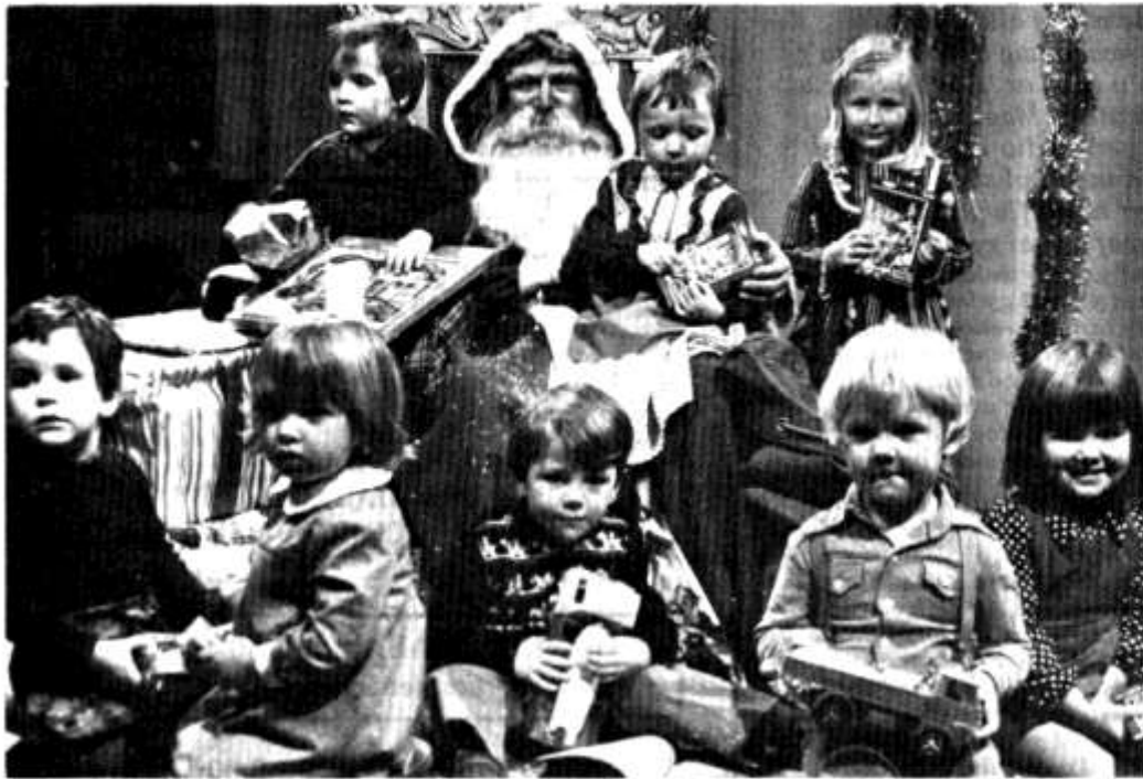
Plant bach o Gaerdydd yn cael croeso gan Siôn Corn yng Nghanolfan Teledu Harlech (gweler "Hamdden" Rhagfyr 22 am 2.00p.m.).

Cofiwch am arheg Nadolig i'r Dinesydd ! Danfonwch gyfraniad, bach neu fawr, ar frys at: