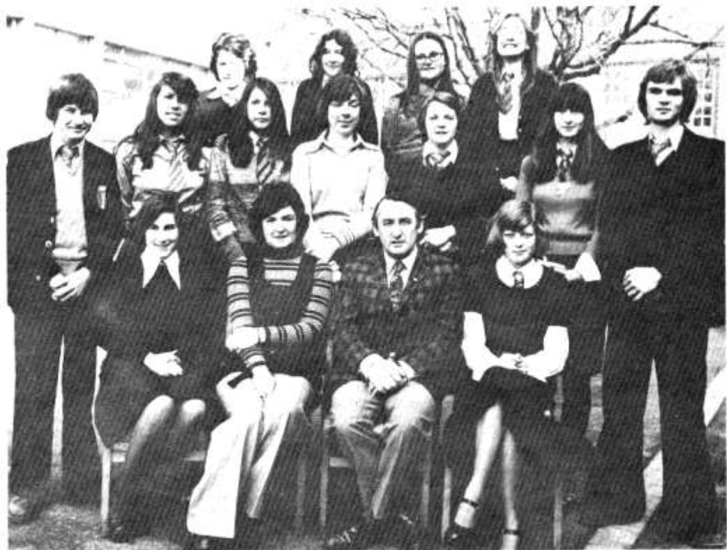
Y parti o Ysgol Uwchradd yr Eglwys Newydd cyn iddynt gychwyn ar eu taith i America ddiwedd mis Mawrth.

(Y Llewod a'r Ceffyl Gwyn; Y Llewod a'r Wennol Goch, y ddwy gan Dafydd Parri, Gwasg y Lolfa. Pris: 65 yr un.)