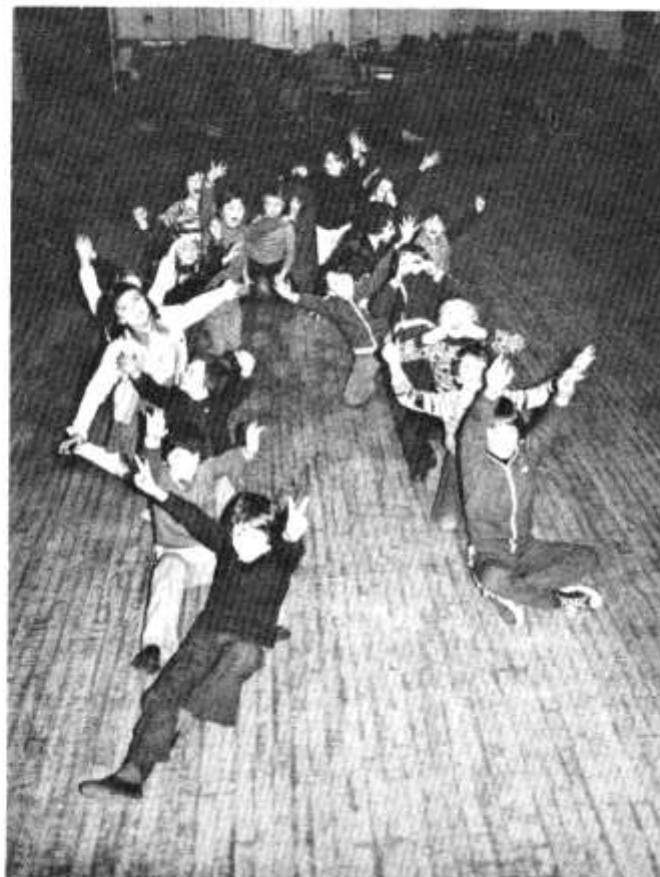
Aelodau Adran newydd sbon yr Urdd yn Y Rhath — cyfarfod am 6.30p.m. bob nos Fawrth yn Ysgol Bryntaf.

Bydd y rhifyn nesaf o'r Dinesydd yn ymddangos ar Fai 7fed. Deunydd ar gyfer y rhifyn hwnnw erbyn EBRILL 26 fan bella, os gwelwch yn dda. Danfoner at: Golygydd Y Dinesydd , 66 Heol Maendy, Cathays, Caerdydd.