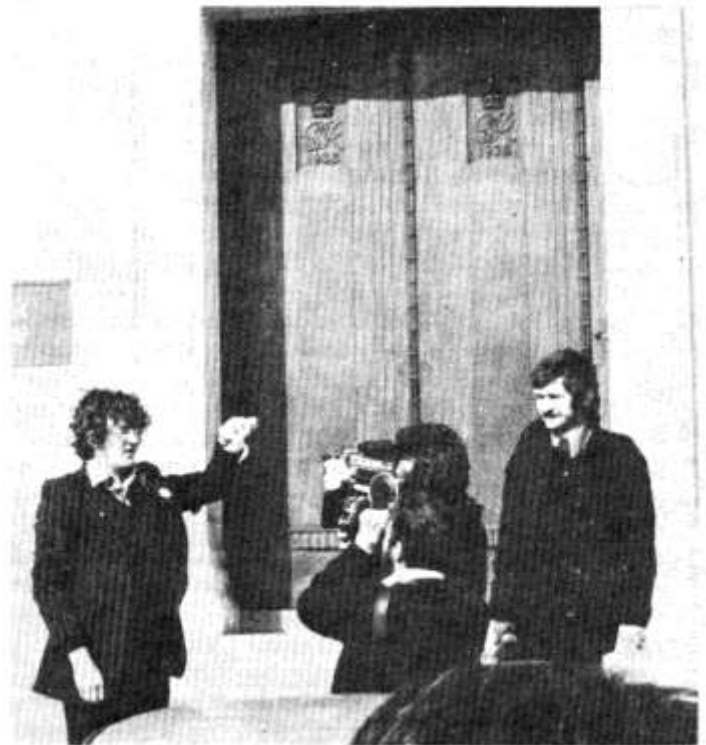
Llosgi trwydded teledu ar risiau'r Swyddfa Gymreig yn Rali Cymdeithas yr Iaith (Mawrth 6ed).