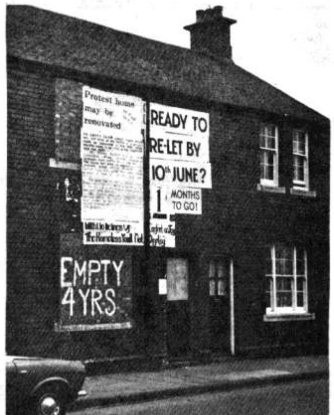
Un tŷ, ymhlith llawer, sy'n cael ei wastraffu. Gweler stori tud. 7.