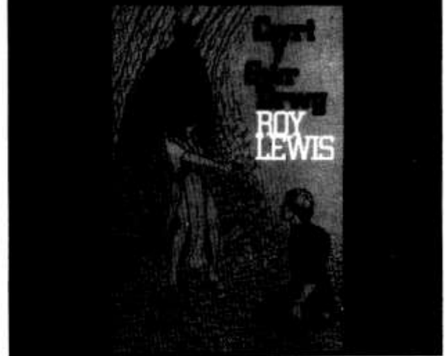
Nofel antur/dditectif orau'r ganrif yn Gymraeg. £1.95