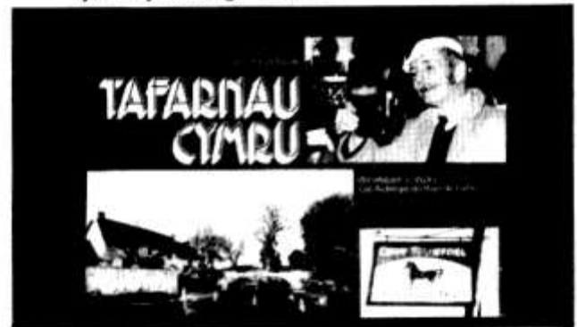
Cant o dafarnau gorau Cymru gyda llun a malu cachu am bob un. £1.25