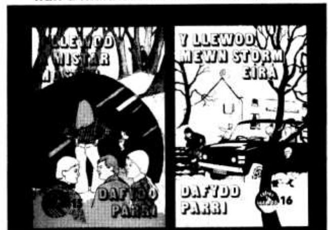
Y Llewod diweddera! 85c yr un