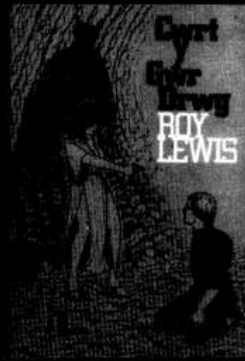
Nofel antur/dditectif orau'r ganrif yn Gymraeg. £1.95