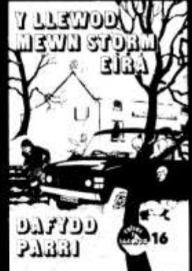
Y Llewod diweddera! 85c yr un