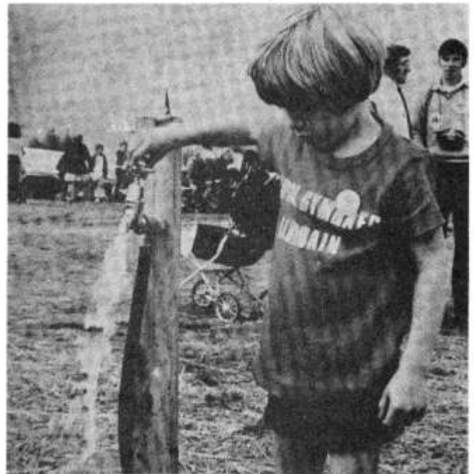
Rhagor o ddwr ac ar ddigygddiadau pauer tan