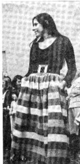
Val ei llyu yn arddangos ar y maes ddde.