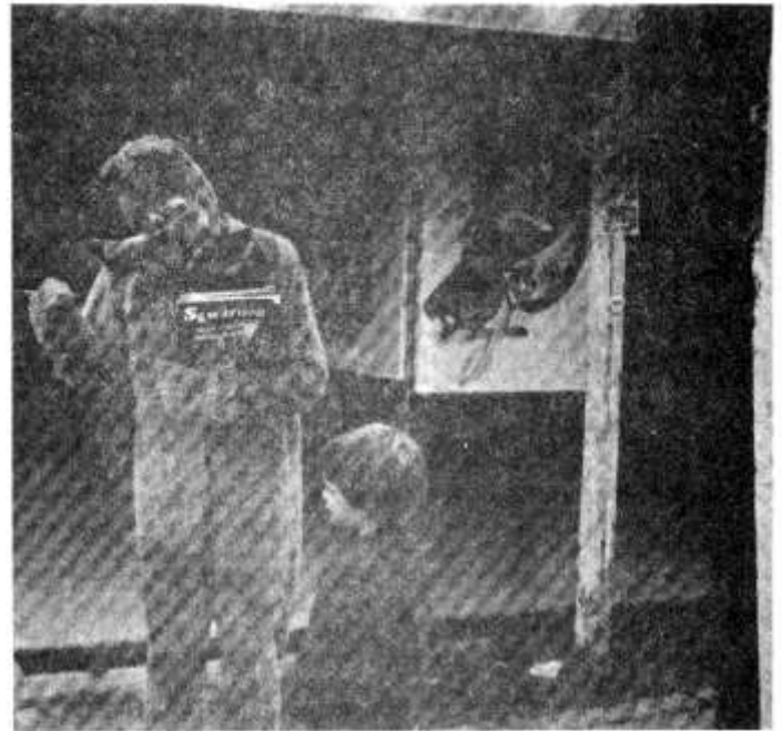
Dynod'r Sgrifffwr sy'n creffwr a wngylch y maes yn hyspabu'r llyfr awrydd cyffwrms i blant..... SGWARNOG.

chymdeithas Gymraeg i hiaith. Oni fedr ein hysgolion yn rhannau prin 'u Cymraeg Cymru wneud darpariaethau ychwanegol fel hyn, yna annhebygol fydd llwyddiant ymdrechion i weld cynnydd yn nifer y genhedlaeth ifanc sy'n Gymry dwyieithog. Afraid cyfeirio at bwysigrwydd hyn yn achos dyfodol y Gymraeg i hun. Gofynnwn felly i chi ystyried unrhyw gyfraniad ariannol, bach neu fawr, fel cymorth uniongyrchol i hybu achos y mae a wnelo'n agos â chadw iaith, diwylliant a thraddodiad i'r oesoedd a ddél. Gwyddoch mor bwysig yw cyfraniad ysgolion fel Rhydfelen yn yr ymdrech unfed awr ar ddeg y mae'n rhaid wrthi i ddiogelu'r agweddau hyn sy'n gyfystyr â pharhad y genedl. Diolch i chi.