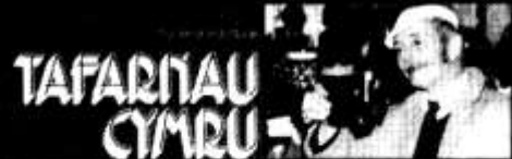
Cant o dafarnau gorau Cymru gyda llun a malu cachu am bob un. £1.25