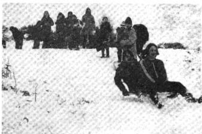
Ar Fynydd y Wenallt.

(Aelod o Grŵp John Williams o Gaerdydd Cyf.)