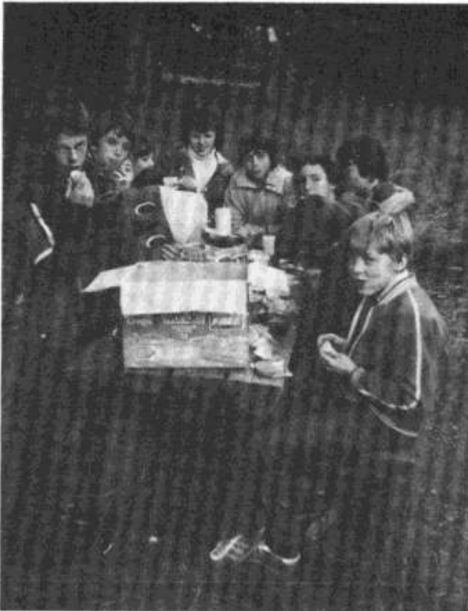
Uwchadran yr Urdd ym Mharc Craig-y Nos yn ystod penwythnos yng Nghanolfan yr Urdd — GLYNTAWE.