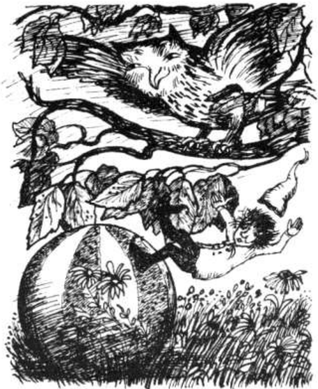
Llun o Garedigrwydd Caradog a Storiâu Eraill, Casgliad o storiâu swynol llawn dychmyg am gorachod, plant ac anifeiliaid gan yr awdures ifanc, wreiddiol Juli Phillips. Tynnwyd y lluniau deniadol (tua 30 i gyd) gan Bernadette Watts. Cyhoeddwyd y llyfr gan Wasg y Dref Wen am £1.40, yng Nghyfres y Wiwer.

Cafwyd un Sadwrn buddugoliaethus (Ionawr 12) pan enillodd y tri thim, y tim 1af yn erbyn y coleg Meddygol a'r ail a'r trydydd yn erbyn Pentyrech. Hefyd, ar fore'r gêm ryngwladol, curwyd tim 1af... canlyniad da yn erbyn tim oedd heb golli ers 8 gêm.