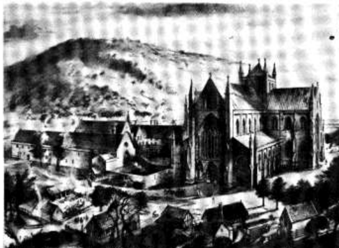
Llan, Amgueddfa Genedlaethol Cymru Tyndyrn Cyhoeddodd yr Amgueddfa ddau gatalog - Alan Sorrell: Ail-greu'r Gorffennol, a'r fersiwn Saesneg, Alan Sorrell: Early Wales Re-created, ar gyfer yr arddangosfa. Cynhwysir ynddynt luniau o bob gwaith dyfrliw Sorrell a welir yn yr arddangosfa. Y pris yw £1.50 yr un (£1.85 drwy'r post).

Yn yr arddangosfa ceir peintiadau o safleoedd cynnar fel Tinkinswood, Sain Nicolas, De Morgannwg; Pond Cairn, Y Coety, Morgannwg Ganol a Llanmelyn, Gwent. Yn ail, safleoedd Rhufeinig yng Nghaerllion-ar-Wysg a Chaerwent, Gwent; Segontium, Caernarfon a Llanilltud Fawr, De Morgannwg. Ac yn drydydd cestyll, ynysys ac abatai.