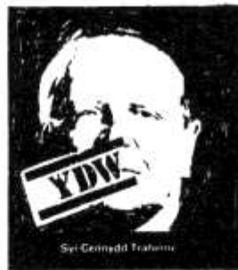
Sir Germedd Trafford