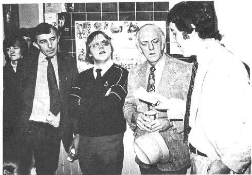
Y tri anffuddugol yng Nghampau'r Urdd am geisio cadw'n effro drwy'r Seremoni Agoriadol!

Yn yr agoriad pwysleisiwyd yr angen am siop lyfrau Gymraeg a fyddai'n ganolfan cyfarfod yng Nghaerdydd yn dilyn cau Siop y Triban bedair blynedd nŵl. Dywedwyd mai cynnig gwasanaeth yw'r nŵd er mwyn ysgwyddo'r baich o gynnal yr