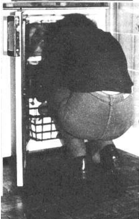
Un o'r cwsmeriaid yn ymweld a Siop Taflen - y siop lyfrau leiaf yn y byd.