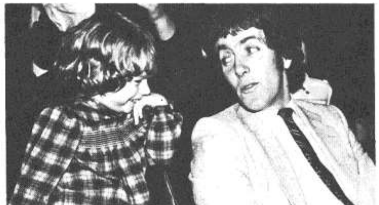
Pwy wyt ti'n galw'n Weiran Gaws?