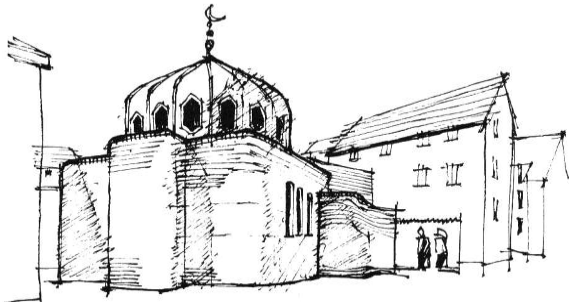
Near Alice Street, Caerdydd

Cymharol dlawd yw ardal y dociau ond er hynny llwyddodd y Fohametanaidd, drwy dderbyn rhoddion sael o wledydd Arabaidd, i adeiladu'r ganolfan hon sy'n galon i'w cymdeithas.