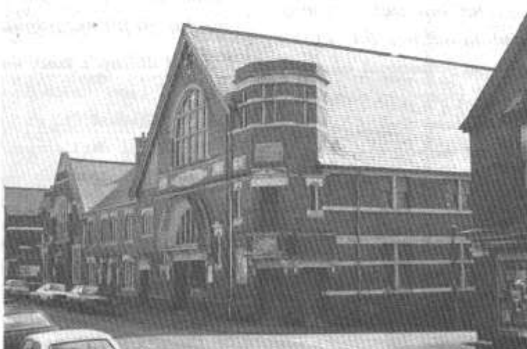
Eglwys Monthermer Road

Cafwyd un awgrym go radical gan y Parch T.J. Davies mewn llythyr agored at aelodau'r Crwys a Minny Street pan awgrymodd y dylai'r ddwy eglwys uno. 'Roedd hynny'n rhy radical i'w ystyried, tybed beth fydd tynged yr awgrym diweddaraf?