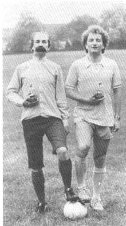
Enghraifft glasurol o 'youth and experience'! - sêr Clwb Cymric am 1983/84.

Ond yn gyntaf beth am grynhoi'r tymor ar y cae. Llwyddiant? Do. Dyrchafiad? Naddo. Mwynhad? Do, digonedd. Sut mae mesur llwyddiant tybed? Wel, ystyriwch i'r tim cyntaf gyrraedd y pydwerydd safle yn y gyngrair gan ennill pedair-ar-ddeg allan o'r pedair ar hugain o gemau a chwaraewyd, a chael cyfarfod o 30 o bwntiau. Ystyriwch i'r ail dim gadw eu safle yn eu cyngrair hwythau.