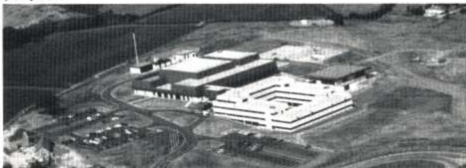
Canolfan deledu newydd HTV Cymru yng Nghroes Cwrlwys. Costiodd y ganolfan dros £15 miliwn.

"Nefar myn yffar i. Wrach na di'r chalets ddim cystal â Byclins ond ma nhw'n rhoi gwylia i ti rownd y flwyddyn yn fama!"