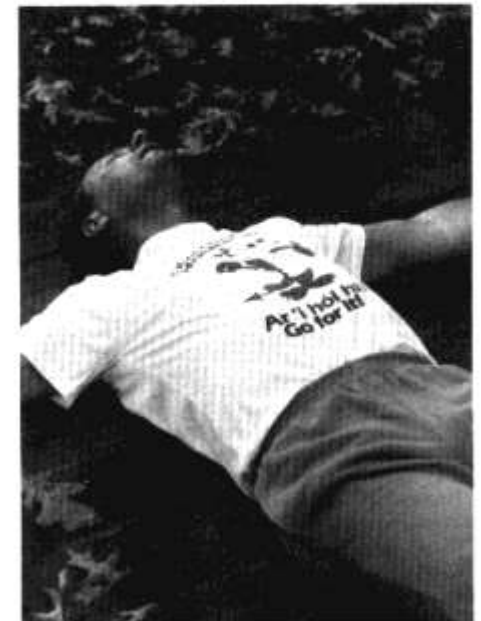
Pwy ddywedodd fod ynna ddim ponygl symbelydedd yn Nhrausfy....