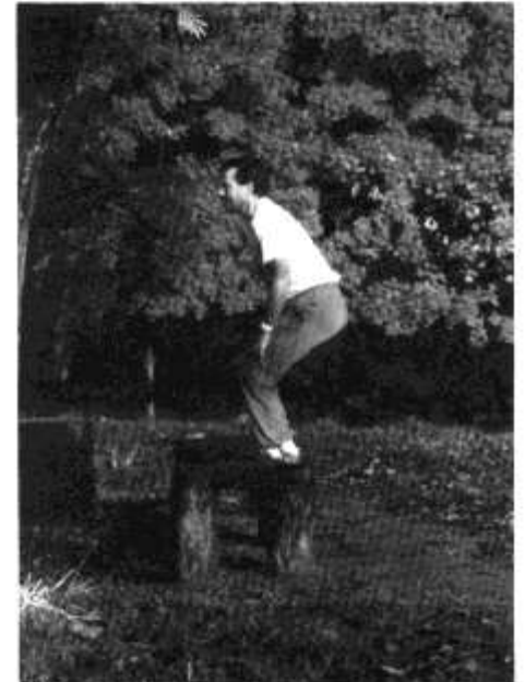
Ble mae'r papur gwyrdd ynna ar gathffosiaeth wedi mynd?