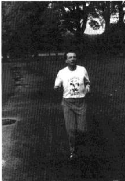
Rhaid codi cwestiwn ynglyn â'r gwasanaeth rheilffordd yma i Stiniog.