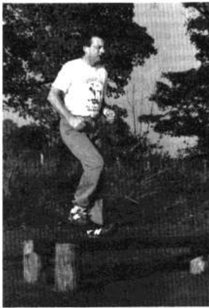
Troed chwith, dde, chwith, chwith chwith, chwith, chwith.....

Enwir yr wyth orsaf ymarfer ar ol siroedd Cymru ac maent yn galluogi'r rhedwr i ymarfer nid yn unig y coesau, y galon a'r ysgyfaint ond cyhyrau'r breichiau, y stumog, yr ysgwyddau a bron i bob cyhyr arall yn y corff!