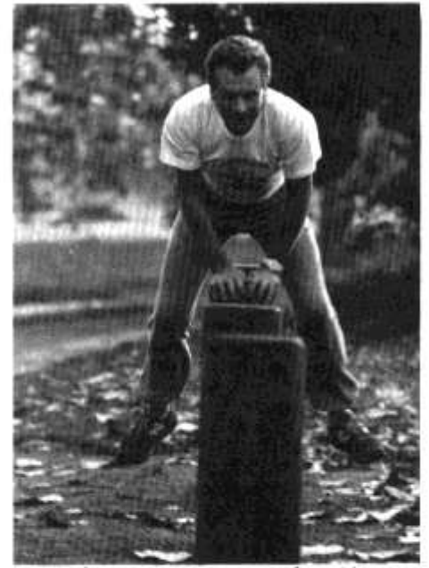
Mae hyd yn oed yr arweinydd yn gofod gwpru chydig weithiau.