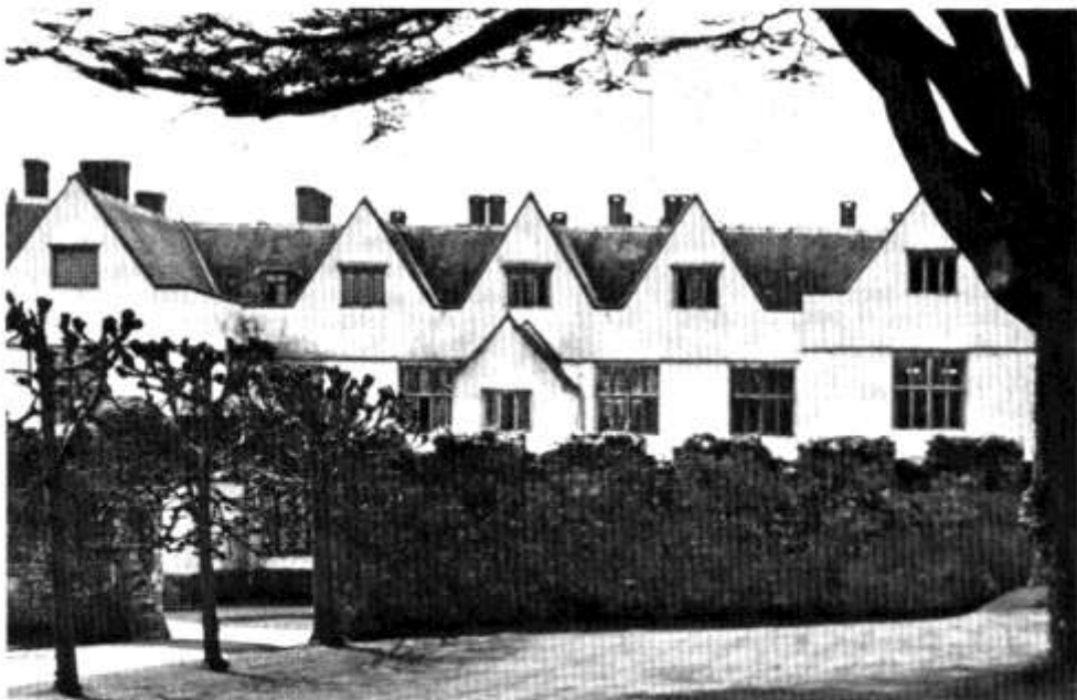
Castell Sain Ffagan - y cam cyntaf tuag at breifateiddio neu gynllun mentrus a fydd yn dlogelu dyfodol yr Amgueddfa? Amser yn unig a ddengys.

Aeth dwy i'r BBC - am y ddramadogfen "Penyberth" ac am ffilm Karl Francis am streic y glowyr, "Ms. Rhumney Valley, 1985" - ac enillwyd y wob fideo gan gwmni Teliesin am y fideo "Enka" a gyfarwyddwyd gan Richard Powelko. (Enillodd y record hir o'r un enw gan Geraint Jarman a'r Cynganeddwyr y wob am record hir orau'r flwyddyn yn noson wobrwyo'r cylchgrawn "Sylw".) Ond tra roedd staff Teliesin yn casgu'r wob yn yr Wyl Ffilmiau lladratawyd eu hoffer fideo o'u pencadlys yn Sgwâr Mount Stuart.