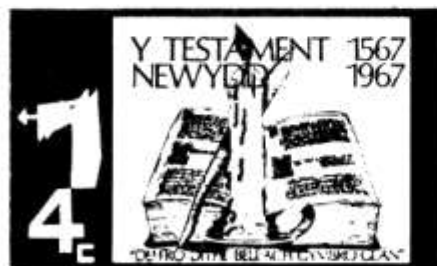
Stamp answyddogol a gyhoeddwyd i goffau cyfieithu'r Testament Newydd gan William Salesbury.