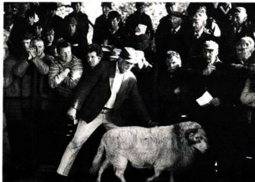
Arwehiant Myheryn, Nelson, Morgannwg Ganol.

PISCES: Mis da yw hwn am faterion ariannol. cymrwch siawns er mwyn elwa'n fwyfwy. Rhaid gwrthsefyll y demtasiwn o gweryla yn y gwaith. Cyn bo hir byddwch yn synnu pawb gyda'ch doniau a'ch gallu.