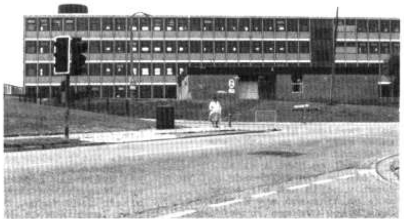
Ysgol Waterhall, yn Y Tyllgoed, sef safle Glantaf 'Isa'.