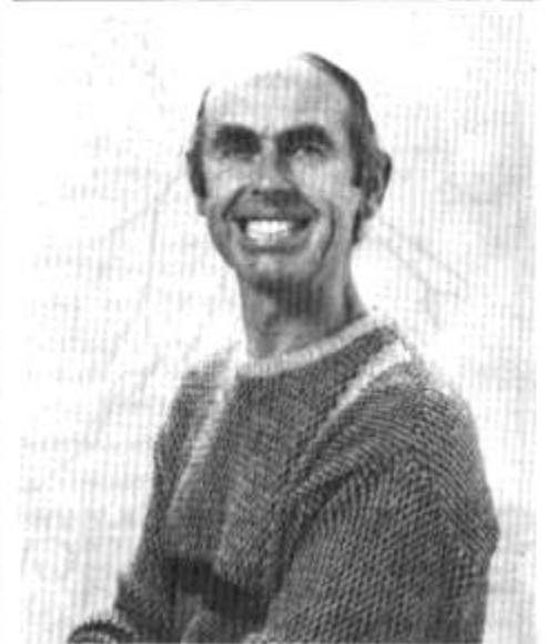
Anrhyedd arall i Gwilym - trowch i dudalen 3.