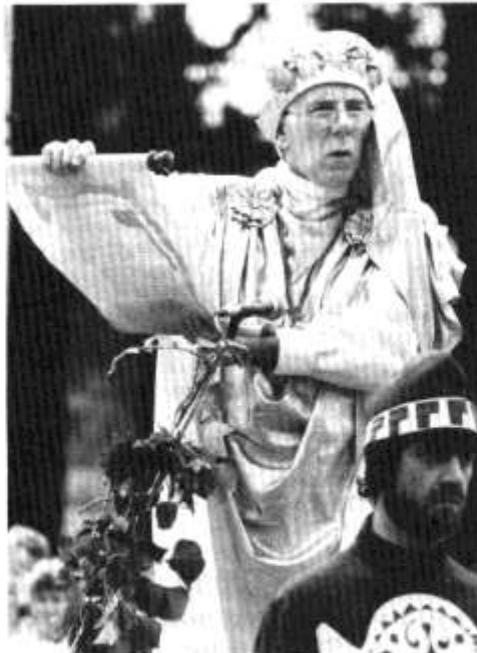
"Mae diwyg Y Faner wedi gwella".