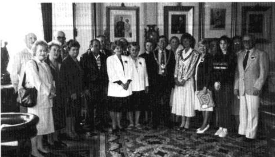
Y criw o'r Wladfa ac un o Goed y Pry yn cyfarfod ag Arglwydd Faer Caerdydd.

Bu criw o'r Wladfa ar ymweliad â Chaerdydd yn ddiweddar, ac roedd Cadeirydd Y Dinesydd ar ben ei digon. Rhyw gymysglyn oedd ymateb y Gwladfawyr ar eu noson gyntaf yma - "SIÂN wedi anghofio rhoi cyfnasa ar y gwely - heb baratoi'r gwely'n iawn! Bu trafod mawr cyn mynd i gysgu - ond yn y diwedd penderfynu cysgu yn y "pethau rhyfedd" oedd ar y gwely. Y bore canlynol cyfarfu'r Gwladfawyr â'i gilydd a chanfod iddynt i gyd gael profiad tebyg. Dyna'r tro cyntaf iddynt weld Duvet ar y gwely.