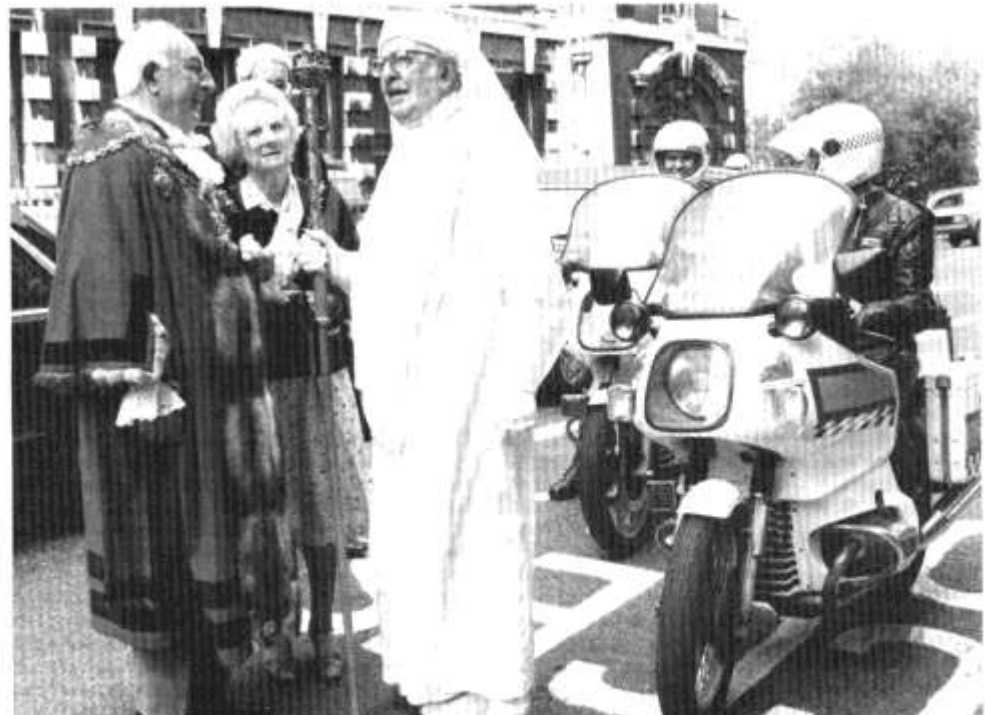
"I'm miles from Newport, Pems!"