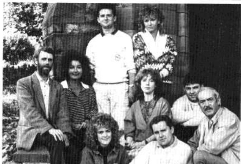
Criw 'Lle Mynno'r Gwynt' yn Y Sherman y mis hwn.