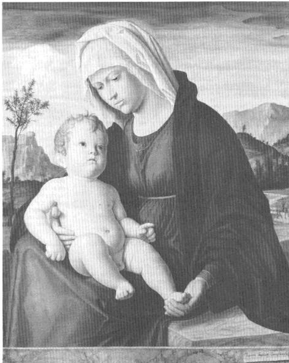
Llun y 'Dolig - Mam a Phlentyn gan Cima