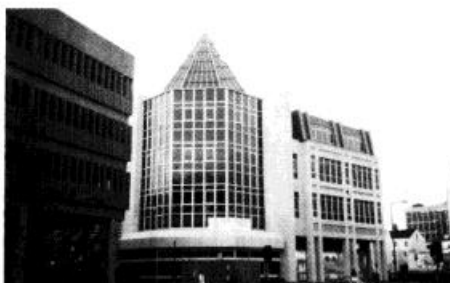
llyfrgell yn ddiogel dan ei ofal ef.

Oddi ar 1982 mae wedi bod yn brif lyfrgellydd a gall Cymry Cymraeg y ddinas fod yn dawel eu meddyliau y bydd ochr Gymraeg y