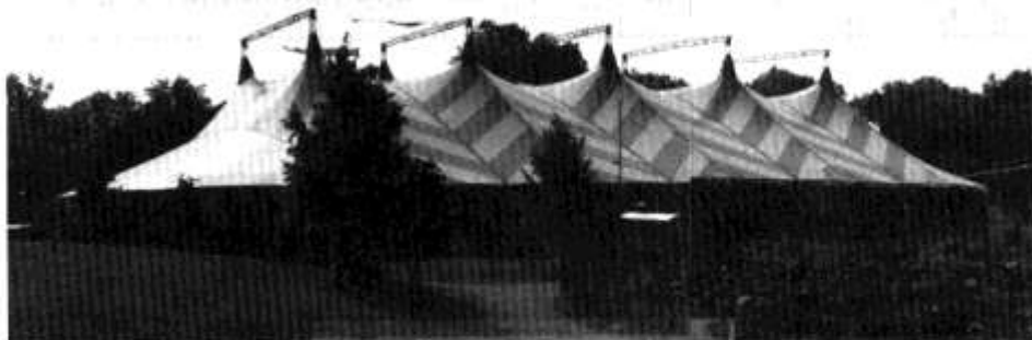
Coeliwch neu beidio dyma pafiliwn newydd Eisteddfod Casnewydd