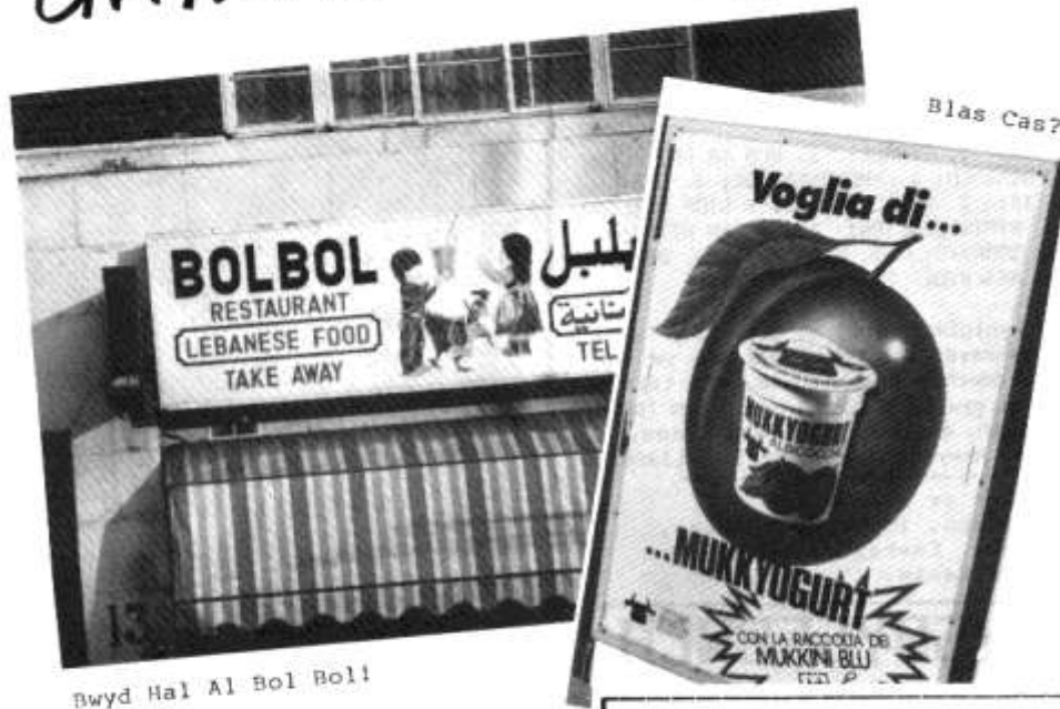
Bwyd Hal Al Bol Boll!

A nosweithiau oer y gaeaf yn nesau beth well na eistedd o flaen y tan ac edrych yn ol ar y gwylliau yna a gawsoch yn ystod yr haf? Dyma ddaun lun blasus a dderbyniodd Y Dinesydd! Tybed a'i Hywel Gwynfryn sy'n cadw'r gwesty?