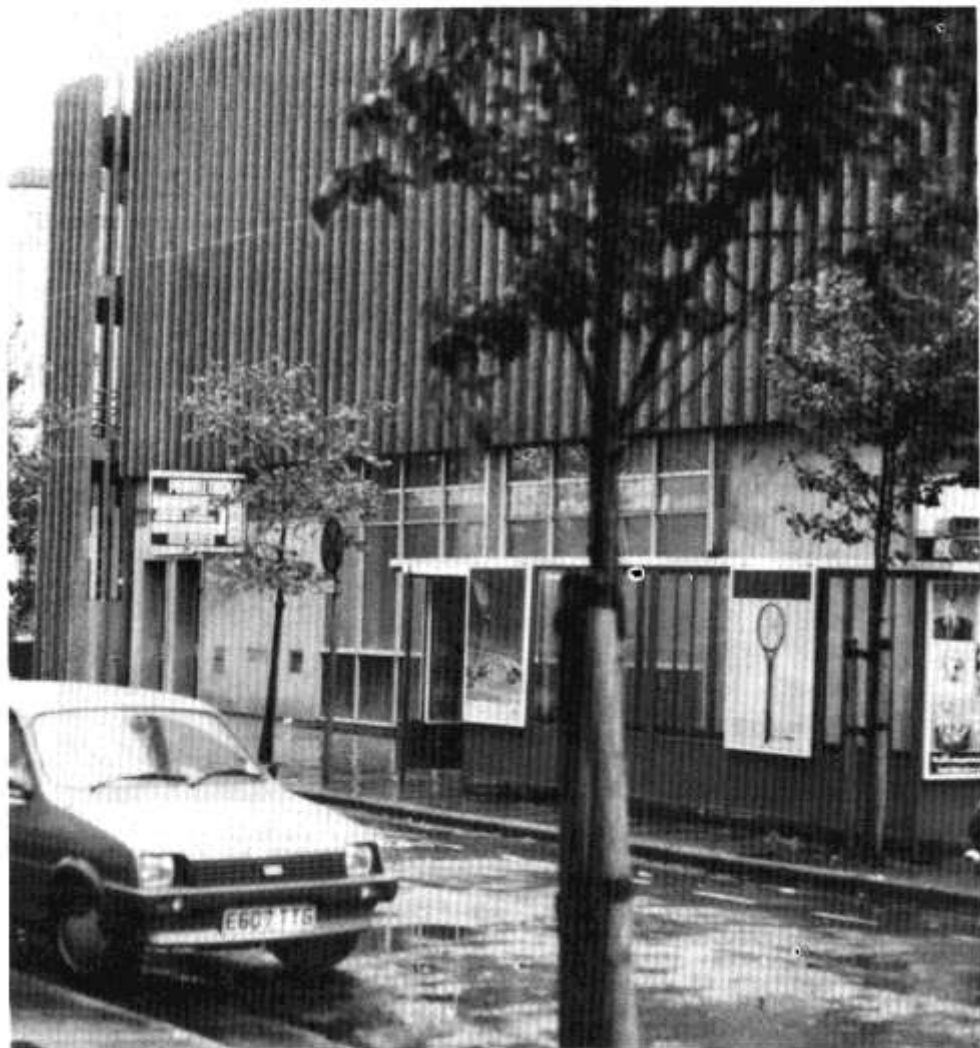
Cartref newydd Oriol? - hen safle Banc Barclays yng nghanol y ddinas.