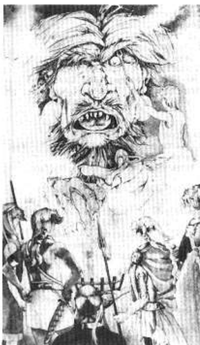
Ysoaddaden Sencawr (Culhwca ac Olwen) O ddarlun gan Margaret D. Jones.

Dyma ddarparu ar gyfer pobl sy'n ymweld â'r Angueddfa, ond ein dylatswydd hefyd yw mynd â'r 'angueddfa' at y bobl. Rhoddir pwys, felly, ar ddarlithio, cyflwyniadau ar radio a theledu, a chyhoeddiadau. Eleni (1988) cyhoeddwyd Straeon Gwerin Cymru (Llyfrau Llafar Gwlad, 10, Gwasg Carreg Gwalch); a The Welsh Folk Narrative Tradition: Continuity and Adaptation (Angueddfa Werin Cymru, ad-argraffiad o'r cylchgrawn Folk Life , cyf. 26). Ym mis Tachwedd/Rhagfyr cyhoeddir hefyd Chwedlau Gwerin Cymru: Welsh Folk Tales (Angueddfa Genedlaethol Cymru), cyfrol ddwyieithog yn cyflwyno chwedlau a thraddodiadau gwerin 63 ardal yng Nghymru, ynghyd â'u cyd-destun hanesyddol a chymdeithasol. Gwnaed y darluniau gan Margaret D. Jones, Capel Bangor, Dyfed. Soiliwyd hwy ar ei map dyfrliw o Gyaru a gomisiynwyd gan Angueddfa Werin Cymru ac a gyhoeddir ar ffurf poster ar y cyd â'r gyfrol. Y mae'r map nodedig hwn (ynghyd â map enwog Margaret Jones o'r Mabinogion) i'w weld yn yr arddangosfa.