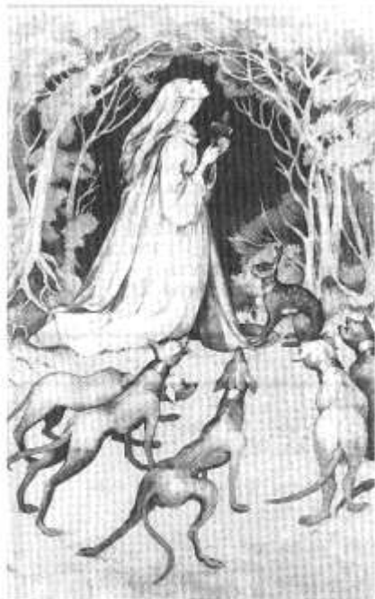
Melangel, Nawddsant yr ysgyfarnogod. O ddarlun gan Margaret D. Jones.

Un cyfrwng allweddol i gyflwyno'r casgliadau yw arddangosfeydd, ac yn yr Angueddfa Werin o'r 21 Hydref hyd 16 Ionawr 1989 ceir arddangosfa ar y testun 'Storïau Gwerin Cymru'.