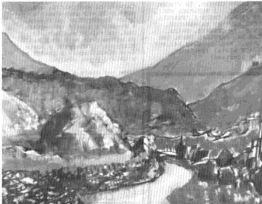
BWLCH LLANBERIS GOUACHE 1986.