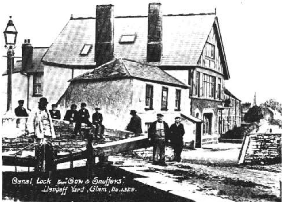
Canal Lock & Bow & Snuffers, Llandaff Yard, Glam, No. 1329.

50 Ffordd Merthyr, Yr Eglwys Newydd. Ffôn 613510