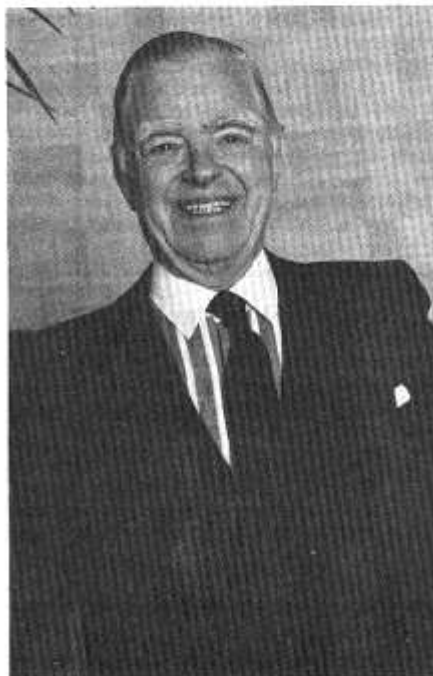
i ddarparu cyllid sylweddol ar gyfer addysg Gymraeg - a' hynny ar frys.

Yn ei farn ef mae sicrhau lle'r Gymraeg yn ysgolion Cymru yn allweddol i ddyfodol yr iaith ac fel cyn-gadeirydd Panel Iaith a Diwylliant y Cyd-Bwyllgor Addysg ac aelod o Bwyllgor Datblygu'r Iaith mae'n gwybod o brofiad am broblemau cyrff ymgynghorol ac yn crefu ar y Swyddfa Gymreig