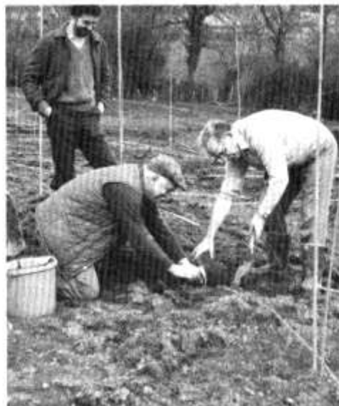
y Plannu Cynnar

'O a'i ddiar ar ôl both ddiguyddodd i Noa druan ar ôl hynny: cystal i chi ddarllen yr hanes drosodd eich hwnain. Ond tybed o fyddai audur Llyfr Genesis wedi talu'r fath sylw i gamp Noa petae o wedi penderfynu mynd ati i blannu cae rudins?