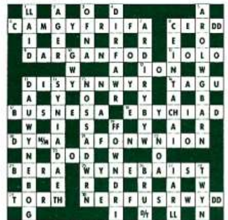
Datrysiaid Rhif 104 - Hydref 1990