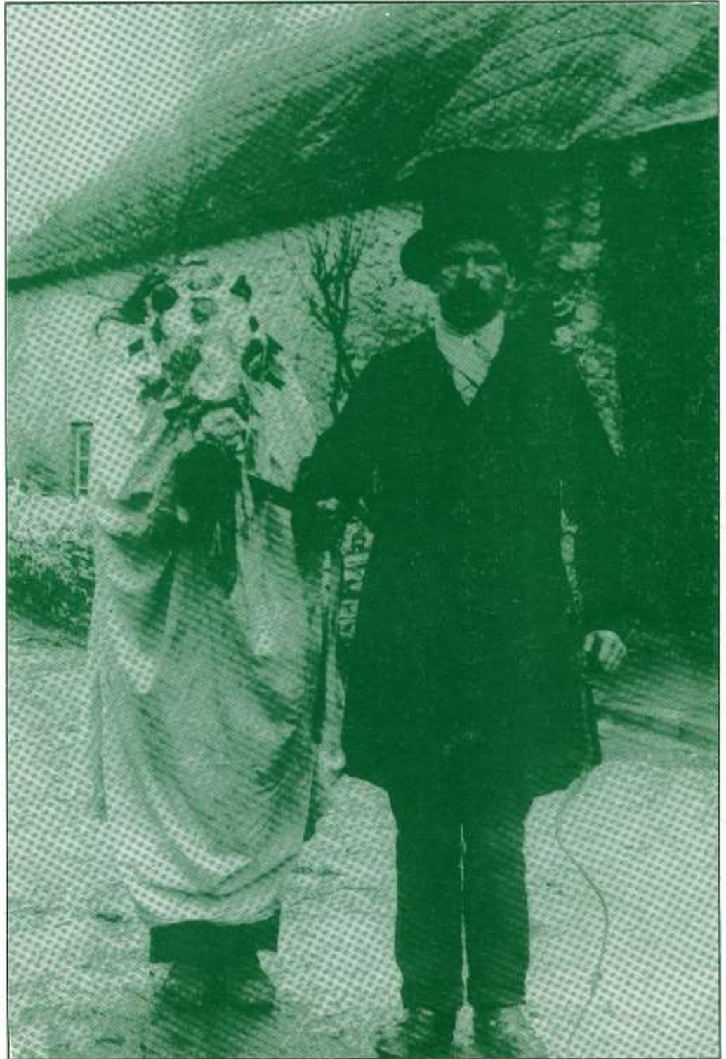
Y Mari Lwyd - o gasgliad Sain Ffagan