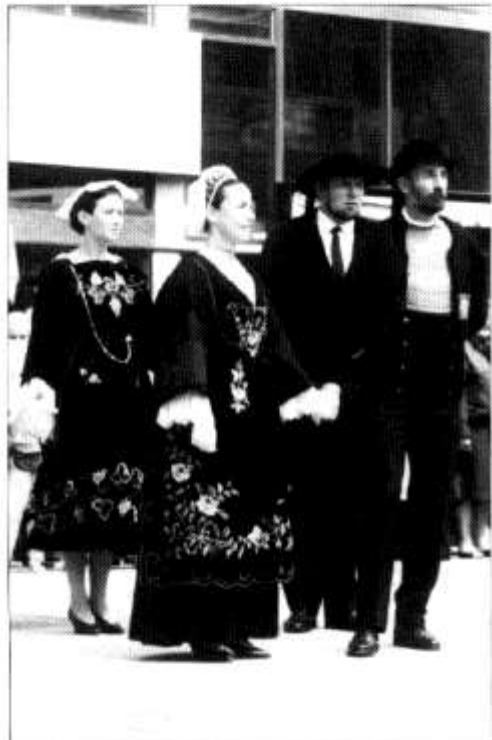
• Dawnsiwr Trebuden o Llydaw, yn arddaru yn Heol y Frenhines yn ystod Gŵyl Ifan y llynedd.

Yn y prynhawn bydd dathliadau yn symud i Sain Ffagan ar gyfer cinio a chodi'r Pawl Haf. Yno addurnir y Pawl Haf â rhubanau cyn