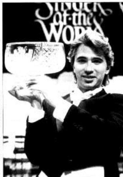
• Dmitri Hvorostovsky o'r Undeb Sofietaidd, Canwr y Byd Caerdydd 1989

Llu o gwestiynau, 'run ohonyn nhw yn newydd, rwy'n gwybod. Ond rhoddodd y rali, arwydd i'r awdurdod fod rhieni Caerdydd yn poeni digon i sefyll gyda'i gilydd i leisio protest. A hwnna falle yw'r cam pwysica tuag at y nod.