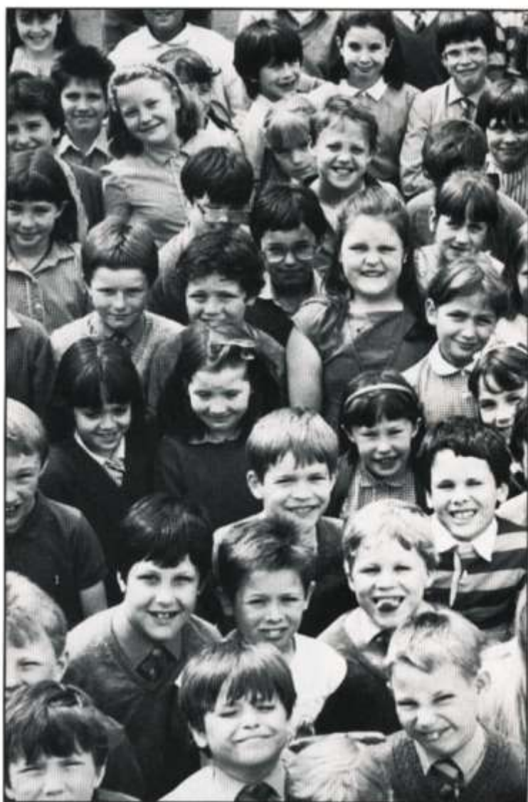
Y twf fydd yn llenwi pymtheg ysgol Gymraeg erbyn y flwyddyn 2000

Gyda disgyblion dosbarth-ladau babanod 1992 yn bwydo'r ffrwd uwchradd erbyn 2000, gobeithir maes o law y bydd modd sicrhau ysgol uwchradd Gymraeg newydd yn y Fro, ac y gwelir agor ail ysgol uwchradd Gymraeg yng Nghaerdydd cyn 1998.