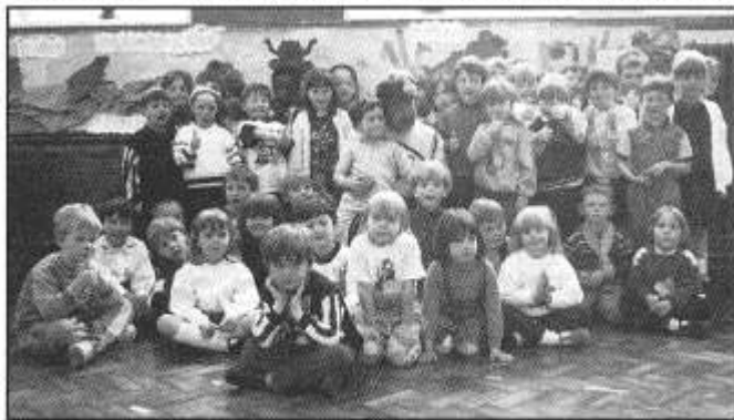
* Ffwrws yn Mhenen i'r Urdd.