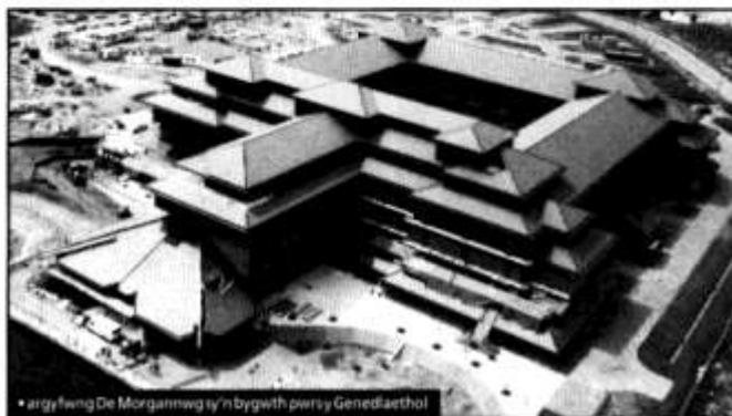
• Argyfwng De Morgannwg sy'n bygyth gwrsy Genedlaethol

Dywedwyd wrth y Dinesydd fod y toriadau yn y grantiau arfaethedig i'r Eisteddfod, yng-