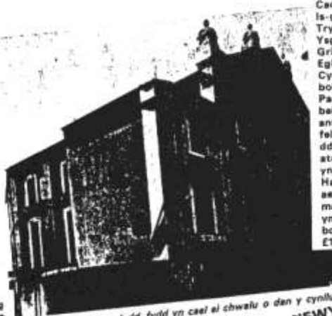
Capel Ebeneser, Caerdydd, fydd yn cael ei chwalo o dan y cynllun i ddatblygu canol Caerdydd.

Gan fod problemau gwerthu Y DINESYDD yn lleng penderfynwyd mewn cyfarfod cyffradinol a gynhaliwyd fis Hydref dweatha ein bod, ar y cychwyn o leia, yn rhannu'r papur yn rhad ac am ddim. Eithr, bydded yn hollol amwg i bob darlennydd bod cyfle liddo, neu liddi, i gyfrannu at y costau cynhyrchu. Yn wir, apelw'n yn daer at bob darlennydd nad yw yn Noddwr i lenwi'r ffurflen isod a chyfrannu UN BUNT am bob deg rhifyn o'r DINESYDD; gwych o beth a fyddai i bob darlennydd fod nall i'n Noddwr neu yn Danysgrifwr. Pan fo pawb yn rhannu'r baich mae'n llawer ysgafnach. Papur cymdeithas Gymraeg Caerdydd a'r Cylch ydyw hwn; gobethio y ceiff ai drin yn anrhydeddus gan bob seol o'r gymdeithas honno.