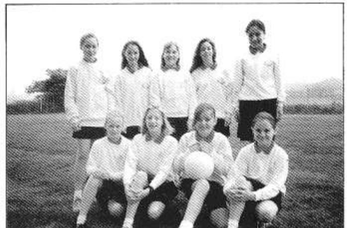
Tim Pêl Rwyd Ysgol Bro Eirwg. (gweler tud. 7)

GWELER HEFYD ERTHYGL COLIN MURPHY AR DUDALEN 3.