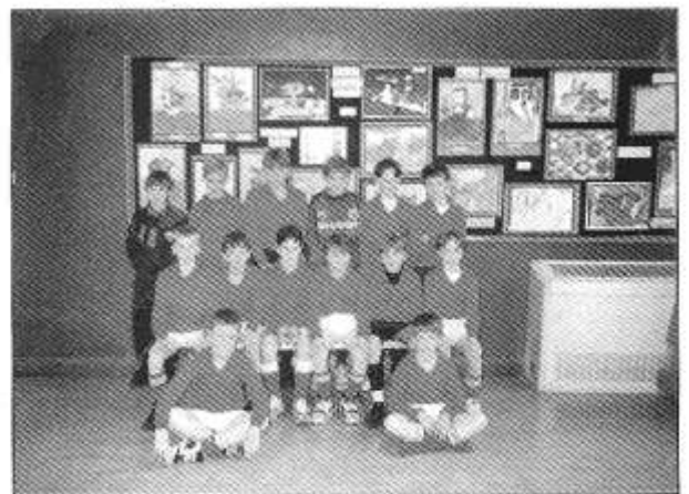
Tim Pêl Droed bechgyn Bro Eirwg