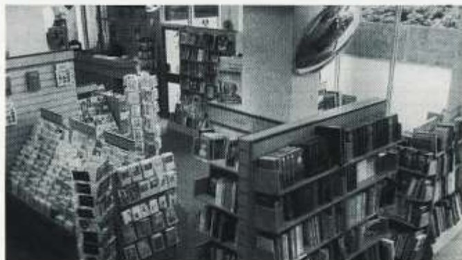
SIOP ORIEL: Arddangosfa dda o lyfrau a chardiau bob amser

Newid arall na fydd yn digwydd ar unwaith fydd colli, o bosibl, yr adran gelfyddydol. Mae'r adran hon wedi bod yn rhan annatod o Oriel drwy'r blyneddau a rhaid wrth dipyn o drafod cyn penderfynu dim, ond efallai y gwelir ei throsglwyddo i ganolfan gelfyddydol sy'n fwy cydnaws â hi yn y man. Un ganolfan a