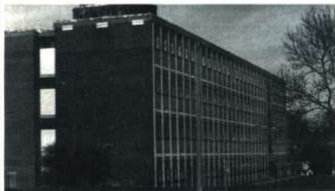
Ysgol Isaf Glan-Taf

Oherwydd y twf cyson hwn a llwyddiant nodedig Glantaf mewn amrywiol feysydd roedd yn amlwg y byddai'n rhaid wrth ysgol uwchradd Gymraeg arall yn hwyr neu'n hwyrach. Teimlid eto mai araf oedd yr Awdurdod yn gweithredu yn hyn o beth er gwaethaf ffigurau arwyddocaol a oedd yn hysbys i bawb, gellid meddwl. (Rhaid nodi er hynny nad oedd y ffigurau a dderbynnid yn gwbl gywir bob tro.) Annerbyniol iawn oedd ambell syniad go simsan a gynigid gan yr Awdurdod. O ganlyniad hawdd oedd eu cyhuddo o fod o leiaf yn llugoer ynglŷn ag addysg Gymraeg a gwnaed hynny weithiau heb ryw lawer o ymdrech i ddeall prob-