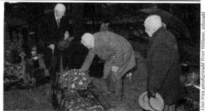
Cyfeillion wrth fedd R G Berry