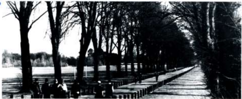
Rhan o Feysydd Pontcanna. Cartre i Eisteddfod Genedlaethol 2000?

Mae lle yno i'r maes ei hun, maes carafanio ar gyfer tuag 800 o garafannau, a'r maes ieuencid. Ond fe fydd angen parcio'r ceir a'r bysys (tua 50 y dydd) mewn mannau eraill a defnyddio'r dull parcio-cludo fel sy'n digwydd ar hyn o bryd yn ystod y Nadolig.