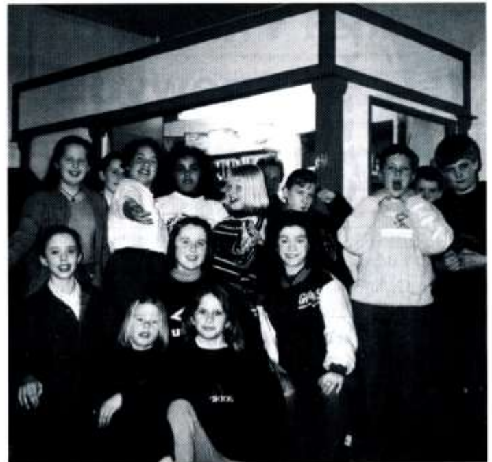
Rhai o'r gweithwyr ar fin torri syched