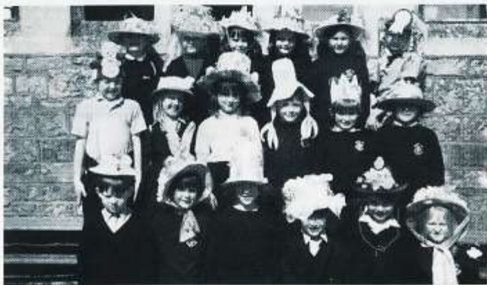
Cap: Rhai o'r plant mewn heliau Pasg del