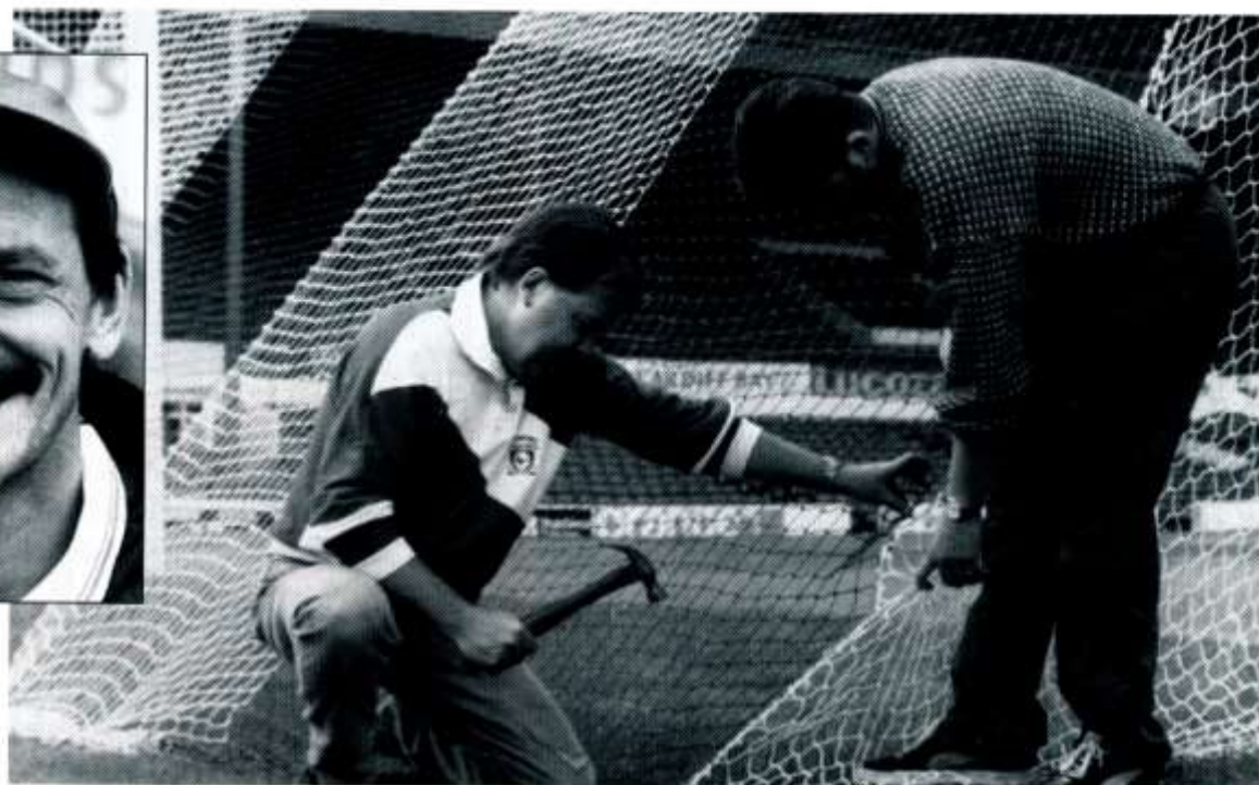
Llun: Robin Griffith