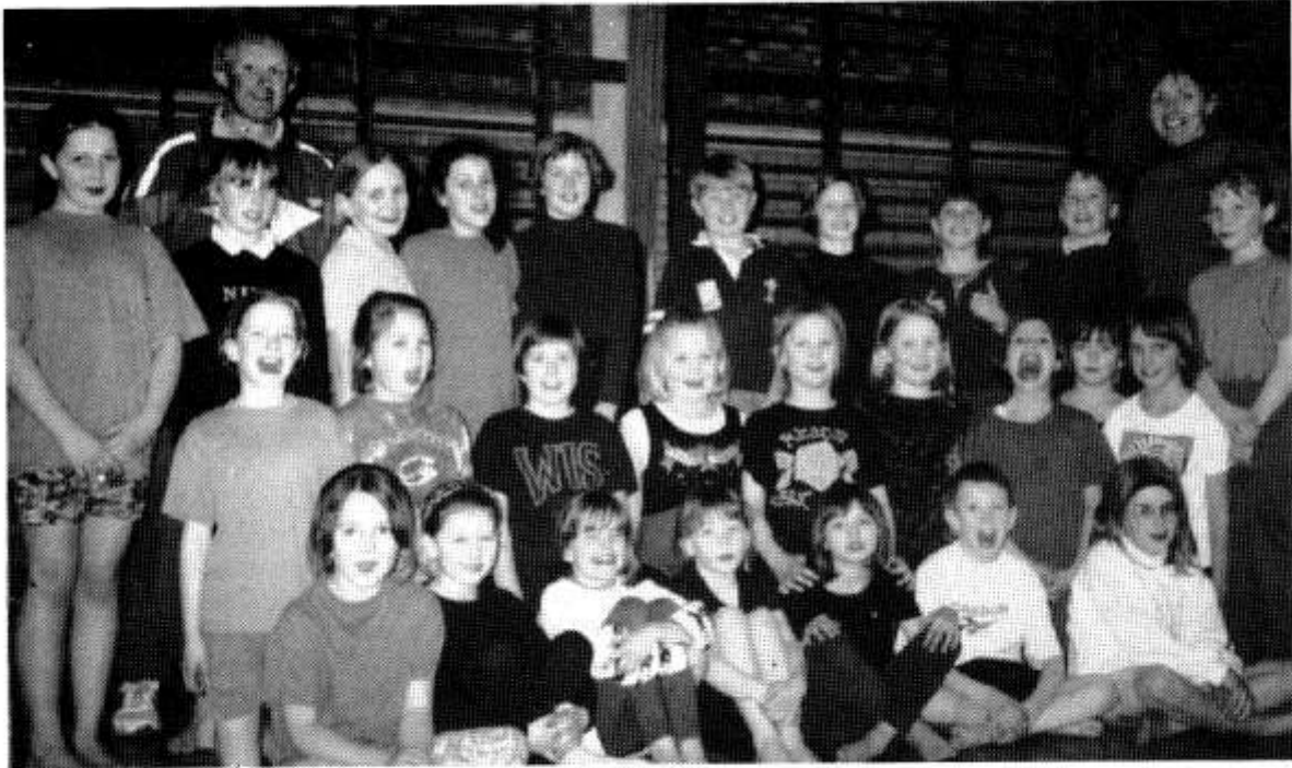
Clwb Gymnasteg Cynradd yr Urdd