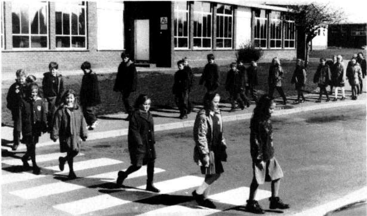
Ysgol Gynradd Y Wern